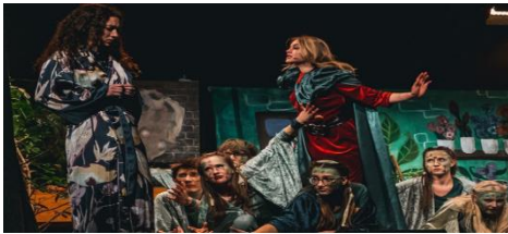
Deutsch LK Q2

Vom 19.01 bis 25.1. wurde unser Blauer Saal fünfmal vom „Grauen“ heimgesucht. Fast zwei Wochen intensives Proben und eineinhalb Jahre Vorbereitung lagen hinter uns. Auf die Aufführungen hatten wir lange hingearbeitet. Wir sind zu einer Gemeinschaft geworden und jahrgangsübergreifend zusammengewachsen. SolistInnen, Chöre, Orchester, Bigband und DS-Kurs brachten die Geschichte von Audrey, Seymour und der fleischfressenden Pflanze auf die Bühne des vom Kunst-LK völlig verwandelten Blauen Saals. Das Publikum war von den schauspielerischen und musikalischen Leistungen aller Beteiligten begeistert! Ein großer Dank gilt allen, die die Aufführungen ermöglicht haben: unseren LehrerInnen, insbesondere aus dem Musik-, DS- und Kunst-Bereich, der Maske, der Regie, dem Technik-Team und „Lichtblick Bühnentechnik“.